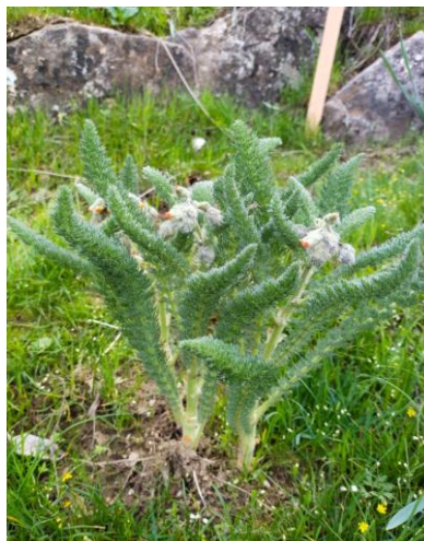
1-rasm. BIEBERSTEINIA MULTIFIDA DC. – morfologik tuzilishi (Vegetativ va generativ organlarining ko'rinishi. Gullash fazasining boshlanishi)

O'zbekistonning tog'li viloyatlarida dengiz sathidan 1200 metr balandlikdan boshlab uchraydigan tur. Bu o'simlikning uzunligi 20-70 sm bo'lib ko'p yillik yo'g'on ildizmevali. Butun tanasi o'ziga xos tukchalar bilan qoplangan. Barglari uzun tortgan tuxumsimon yoki lansetsimon, guli aktinomorf, changchisi 10 ta, urug'chisi 5 ta meva bargdan shakllangan [2,3,4,5]. Muhim dorivor o'simlik sifatida xalq tabobatida keng qo'llaniladi.