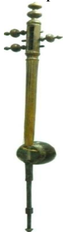
kosasi kokos yong'og'i

O'zbek xalq cholg'ularini davr talabiga moslashtirish jarayonida u aynan g'ijjklarning kosaxonasini har xil xomashyodan, ya'ni kokos yong'og'i, qovoq, mis va yog'ochdan yasagan. Mazkur cholg'ularga raqamlar qo'yilib, ularning ovoz tarovati bir sozanda tomonidan sahnada parda ortida jonli ijro orqali tinglab ko'rilgan hamda ularni bir-biriga qiyoslash natijasida kosasi yog'ochdan yasalgan cholg'u maqsadga muvofiq deb topilgan 3 .