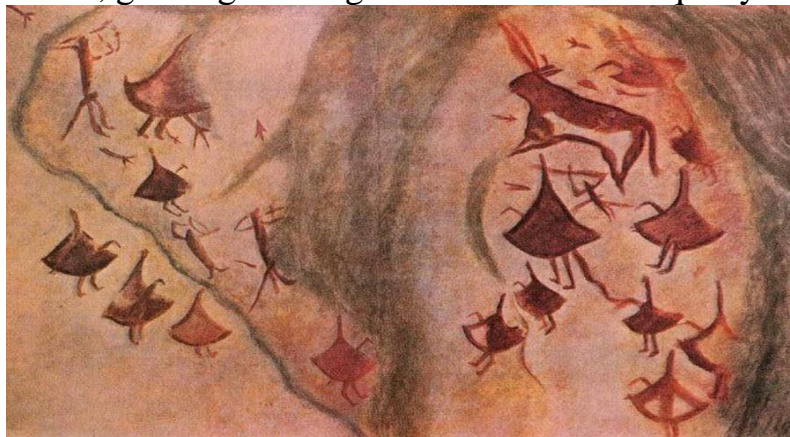
2-rasm. Zarautsoy darasi (g‘ori) dagi rasmlari