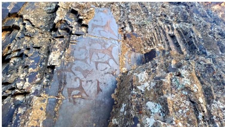
3-rasm. Toshga aylangan tarix - Sarmishsoy "san'at galereyasi"