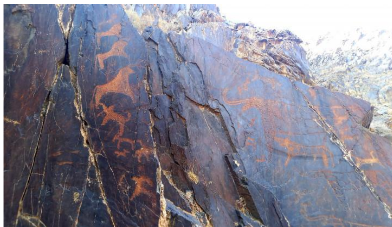
4-rasm. Toshga aylangan tarix - Sarmishsoy "san'at galereyasi"

Buqa turlarning eng qadimiy tasvirlari esa miloddan avvalgi VII-II ming yillikda yaratilgan. Bu yerdagi sak-skif qabilalarining hayoti bilan bog'liq bo'lgan dastlabki temir davri (miloddan avvalgi IX-II asrlar) kiyik, arxar, tuyalar, otlar va chavandozlar tasvirlari, ov manzaralari va marosimlari bilan ifodalanadi.