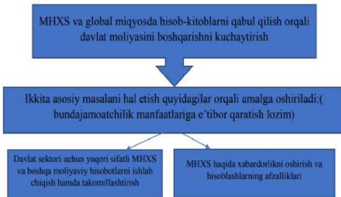
2-rasm. MHXS ni takomillashtirish bo'yicha 2019-2023 yillarga mo'ljallangan strategiya. (IPSASB at a glance, 2019)

Hozirgi kunda deyarli barcha mamlakatlarda MHXS qo'llanilmoqda. Ushbu sohani yanada takomillashtirish maqsadida xalqaro MHXS fondi tomonidan 2019-2023 yillarga mo'ljallangan strategiya ishlab chiqildi. Unga ko'ra MHXS orqali davlat moliyasini boshqarishni kuchaytirish va global miqyosda hisob-kitoblarni qabul qilishni oshirishga quyidagi vazifalarni amalga oshirish orqali erishishimiz mumkin: (2-rasm)