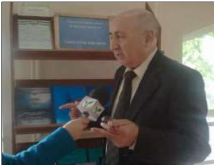
ЎзДСи халқаро илмий конференция ҳақида Ёшлар телеканалига интервью. 2011 й.

Талабага дарс бериш шунчаки 90 минут гапириб вақтни ўтказиш эмас, уларга келажакда фойда бўладиган нимадир ўргатиш вазифаларини чуқур англаган устозларимиз қисмати ҳар томонлама бизни эргаштирувчи, ҳаракатлантирувчи улкан тажриба самаралари эканини англайман.” Устоз “50 йилдан бери педагоглик қилаётган бўлсам ҳам, дарсга киришимдан олдин ҳалигача ҳаяжон босади, талабаларга бугун улар дарсни кўпроқ ўзлаштиришлари учун қолаверса, зерикиб қолмаслиги учун қандай дарс ўтсам улар учун фойдали бўлади, қандай қизиқтираман, деб ташвишим аримайди. Бугунги кун талабалари фикр дунёси, ўзига ҳос талаблари ҳамда замон