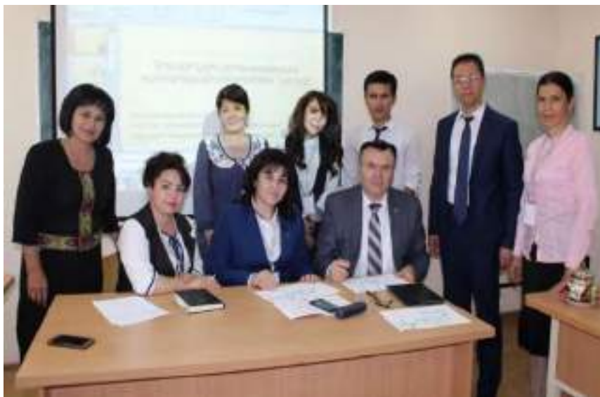
Халқаро конференцияда ҳамкасблари билан

Копток машқлари талабани гавдасини тўғри тутиб туришига, овозни йўналишига, равон ва тоза талаффузга эга бўлишига ва талабанинг диққатини тарбиялашга ёрдам беради. Копток билан ишлаганда диққат бир жойга йиғилмаса натижа яхши чиқмайди. Бунинг учун педагог талаба билан албатта диққия устида эринмасдан, ҳар бир машқ устида битталаб тўхталиб ишлаши зарур. Копток билан ишлаганда ҳар бир машқларни санъаткорона бажарилиши керак.