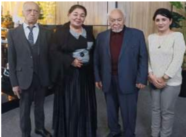
Ўзбекистон халқ артистлари Ёқуб Аҳмедов, Турғун Азизов