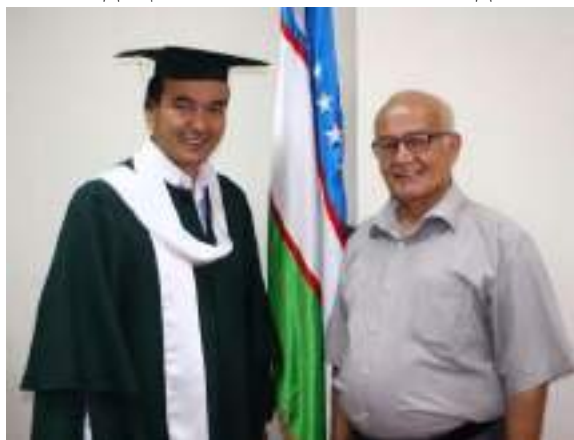
Ўзбекистон Республикаси Маданият Вазири, Назарбеков Озодбек Аҳмадович билан