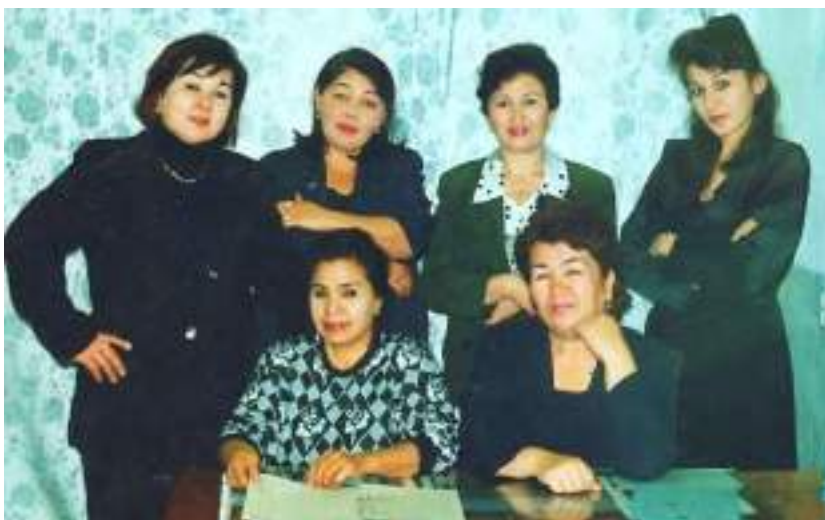
А.Н.Островский номидаги Тошкент театр ва рассомлик институти. “Саҳна нутқи” кафедра йиғилишидан сўнг 1999-йил.