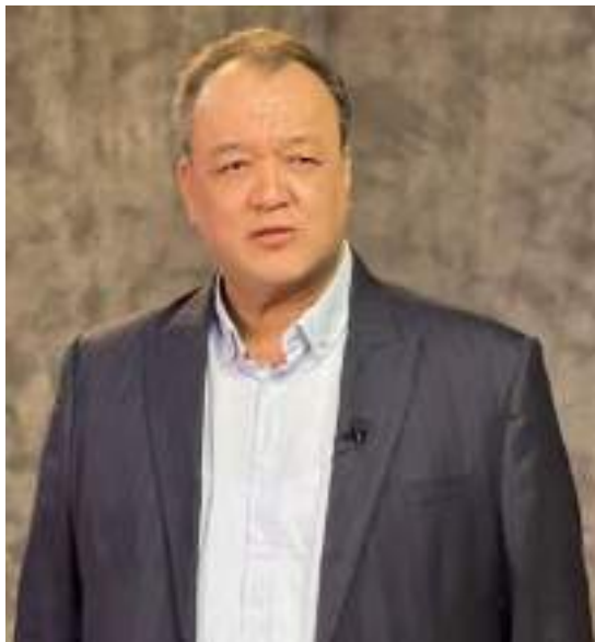
Профессор в.б Рамз Қодиров

Муаллиф айнан бугунги кун талабидан келиб чиққан ҳолда, илғор педагогик технологиялар, интерфаол усуллар билан талаба-актёр, талаба-режиссёр, талаба-бошловчи учун керакли маълумотларни кашф қила олган. Дарсликда бир неча машқлар схема шаклида, алоҳида бўлақларга бўлинган ҳолда бурилган. Нутқ аппаратлари анатомиясининг фотосуратлари жойлаштирилган. Бугунги кун талабасининг китобга бўлган меҳрини ошириш бир мунча мураккаблигини ҳаммамиз сезиб турибмиз. Бу дарсликни очган киши қизиқиб қолиши ва яна варақлаб охиригача кўришга интилади. Нафас, овоз, техник машқлар билан ифодали ўқиш ва бадиий сўзга етишиш учун қилинадиган машғулотлар асосланиб келтирилган. Дарсликдаги янгилик унли товушлар устида ишлашни анъанавий И товуши билан эмас, ноанъанавий А товушидан бошлашни таклиф қилганлар. Яъни, “И, Э, А, О, Ў, У, И” эмас, аксинча “А, О, Ў, У, И, А” [3].