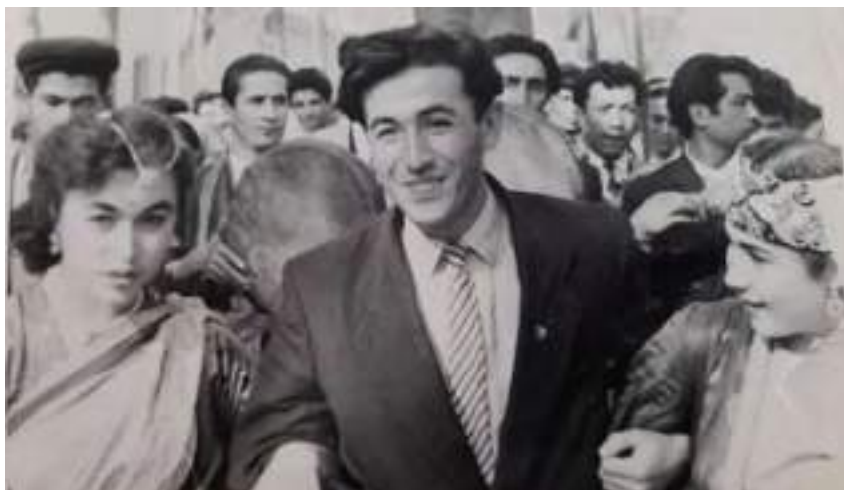
Institut tadbirlaridan lavxa

Qo'shiq kuylash mahorati bilan "qoyil, bo'lar ekanku" deb xursand ham bo'lamiz. Ammo gapirish yoki to'rt qator she'r o'qishga kelganda she'va, lahja, mahalliy nutq, tovushlar poyma-poyligi, kelishiklar o'rinsizligi, noo'rin ishlatilishi hollariga duch keladi. Ayniqsa, Surxondaryo, Qashqadaryo, Samarqand viloyat maktablarini tugatganlar orasida ba'zan i tovushi o'rniga e, e tovushi o'rniga esa i tovushini ishlatish holatlari uchraydi.